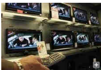
Las campañas para la adaptación a la TDT comenzaron en 2006.