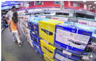
Granada, afectada por las tres fases de apagado, tiene un nivel de adaptación a la TDT superior a la media andaluza.